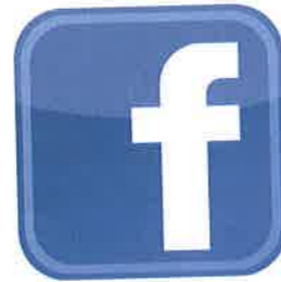
Mynd 16.2 Facebook er dæmi um tengslanet á samfélagsmiðlum

Fjórða tegund tengslanets er tiltölulega ný af nálinni. Þar er um að ræða tengsl á Facebook, Twitter, Snapchat og öðrum samskiptamiðlum á netinu. Þar er auðvelt og fljótlegt að senda skilaboð um hvað maður sé að fást við og sömuleiðis fljótlegt að komast að því hvað vinnur séu að bauka. Með þessu móti upplifa margir notendur samskiptamiðla svo mikla nálægð við aðra að þeim finnst næstum eins og þeir séu í sama herbergi. Þar er einnig mögulegt að eignast nýja vini og fá þannig á tilfinninguna að maður sé hluti af stærri hóp.