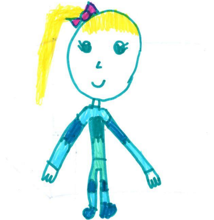
Sóley Heiðarsdóttir, 7 ára