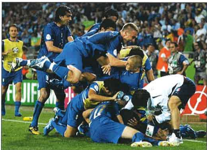
Mynd 1: Samfögn

Mörk í fótboltaleik eru ekki mörg og því eðlilegt að menn gleðjist þegar þeir ná að skora. Það er nokkur munur á því hvernig menn velja að tjá gleði sína og í því liggur sviðslistin. Hluti af gleðinni og athöfnunum er ósjálfráð vegna hormóna sem flæða um líkamann við atburðinn en hluti fagnaðarlátanna er meðvituð hegðun sem gaman er að velta fyrir sér og kanna. Til að nálgast þetta viðfangsefni hef ég flokkað þessi fagnaðarlæti leikmanna niður í þrjár gerðir; samfögn, sérhögn og hópfögn.