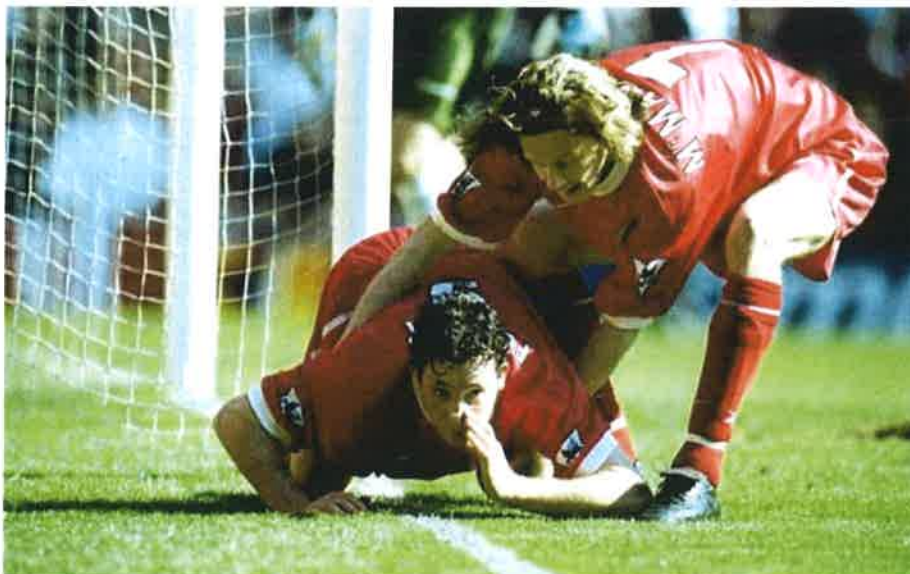
Mynd 5: Umdeilt fagn Robert Fowler

Táknin og hreyfingarnar eru oft almenn. Sá sem sér þau þarf ekki að hafa þekkingu á fótbolta eða leikmanninum til að skilja hverju hann er að koma á framfæri. Dæmi um þetta er þegar leikmaður gefur fingurkoss til áhorfenda til að þakka þeim stuðninginn eða tekur með lófum utan um olnboganna á sér og vaggar þeim fram og til baka rétt eins og hann sé með barn í fanginu. Önnur tákn sem leikmenn gera eru öllu flóknari og erfitt fyrir þann sem ekki þekkir til leiksins að greina hvað er verið að segja með þeim. Dæmi um það er þegar Robert Fowler, þáverandi leikmaður Liverpool hljóp út að endalínu í kjölfar þess að hafa skorað, lagðist í jörðina, lagði vísifingur fyrir aðra nösina og þóttist vera að sjúga endalínuna upp í nefið á sér (sjá mynd 5). Með þessu fagni var hann að deila á orðróm sem gengið hafði um hann um neyslu eiturfjfa (News.bbc.co.uk, 1999 og Poppindacriss6, 2004).