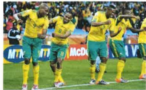
Mynd 7: Marki fagnað með hópdansi

Hér virðist meginmarkmiðið vera að skemmta áhorfendum og kannski sjálfum sér líka. Mörg þessara fagna vísa til bardaga og hermennsku og þá í framhaldinu til hetjudáðar. Dæmi um það er þegar leikmaður hleypur að hornfánanum og grípur hann og notar sem sverð til að slá liðsfélaga sinn sem skoraði markið til riddara (RandolphAthletics, 2012). Annað dæmi er þegar sá sem skoraði tekur upp ímyndaða byssu og skýtur liðsfélaga sína einn af öðrum í hausinn þegar þeir hlaupa fram hjá (Robinson, 2010). Dans er líka áberandi í þessum fögnum, tveir eða fleiri taka sig til og taka nokkur dansspor fyrir framan áhorfendurnar (Paradoxx7, 2010). Látbragðsleikur er líka nokkuð algengur, hermt eftir athöfn, t.d. leikmenn róa bát, keyra bíl, stilla sér upp eins og verið sé að taka myndir af þeim og annað sem greinilega hefur fyrst og fremst skemmtanagildi, sprell til að skemmta sér og öðrum. Gleði og glens eru sennilega aðalsmerki í þessari gerð fagna en áfram eru sömu tákn í fögnunum, tilvísanir í karlmennsku og er hér ímynd íþróttarinnar kannski skýrust, að hún snýst um karlmennsku og skemmtun.