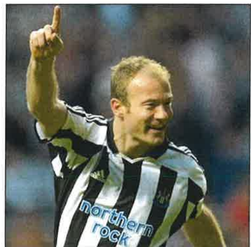
Mynd 3: Einkennisfagn Alan Shearer