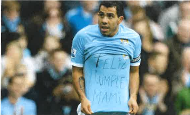
Mynd 4: Dæmi um skilaboð í fögnum

fagnið sé fyrirfram ákveðið, það þarf ekkert að vera í fyrsta skipti sem það er gert en þegar leikmaðurinn ákveður að endurtaka það næst þegar hann skorar er komin greinileg og meðvituð sviðslist. Einnig er algengt að leikmenn komi einhverjum skilaboðum áleiðis í fögnum sínum, sem þá er augljóslega undirbúin sviðslist. Dæmi um slíkt er þegar þeir eru með skrifuð skilaboð undir treyjunni sem sést þegar þeir lyfta henni upp eða þá nota hendur og líkama til að koma skilaboðunum á framfæri (sjá mynd 4).