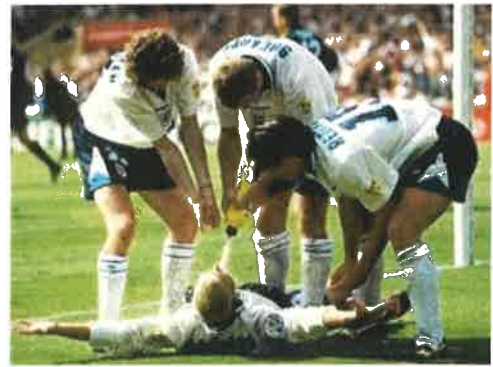
Mynd 8: Hópfagn þar sem leikmenn leika eftir tannlæknum

Schechner, R. (2006). Performane studies: An introduction . 2. útg. New York og London: Routledge.