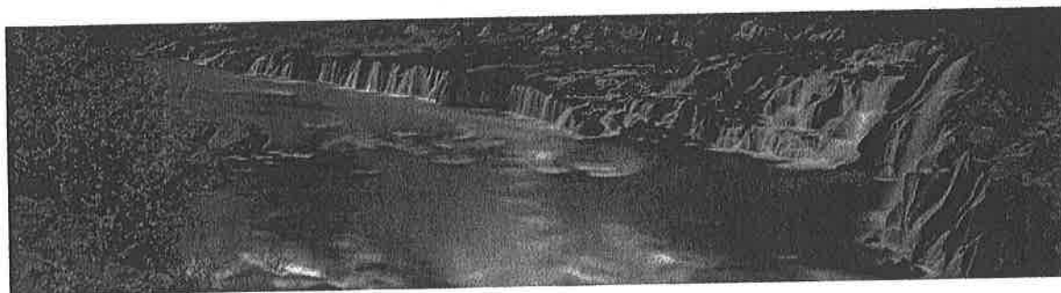
Hraunfossar í Borgarfirði