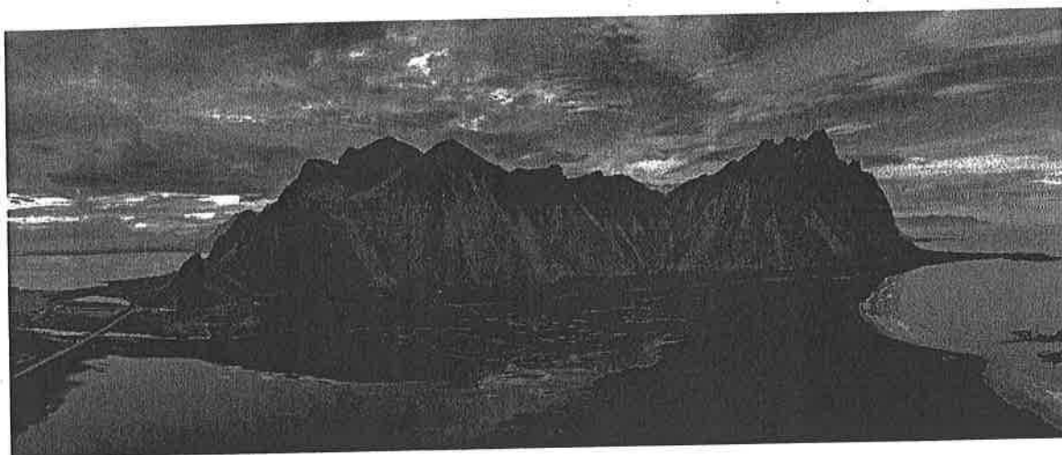
Vestrahorn, austan við Höfn í Hornafirði