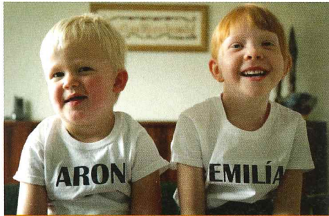
Þrátt fyrir yfirburðavinsældir eru nöfnin Jón og Guðrún á hröðu undanhaldi. Aron og Emilía hafa verið vinsælustu nöfn nýfæðdra barna nokkur síðustu ár. Nafnið Katrín fylgir reyndar fast á eftir Emilíu .

Það sést líka að mannanöfnum sem tengjast norrænni goðafræði er sifellit að fjölga. Fram til 1855 þekktust aðeins nöfnin Iðunn , Baldur og Nanna en síðar bættist við fjöldi annarra goðafræðinafna, svo sem Sif , Óðinn , Embla , Loki , Freyr , Týr , Freyja og mörg fleiri. Nú er nafnið þór eitt af algengustu nöfnum landsins.