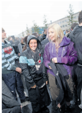
Allir vinir Það fór ekki mikið fyrir svívirðingum í garð nýnema.