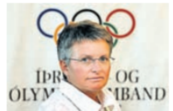
KOM FRAMKVÆMDASTJÓRA Á ÓVART Umfjöllun um ofbeldisfullar busavígslur innan íþróttahreyfinga kom framkvæmdastjóra ÍSí verulega á óvart.